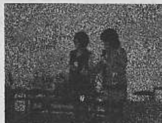
↑ 『交流会での ひとこま』→